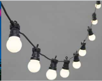
Guirlande LED 220V